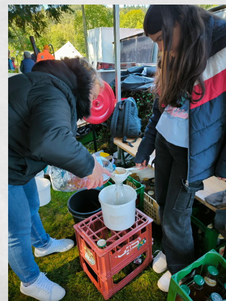
4. Filtration du jus et mise en bouteilles