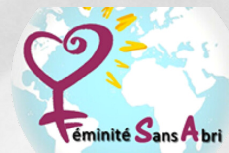
Dons de produits d'hygiène