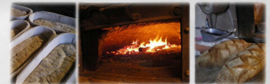
Boulangerie des abeilles