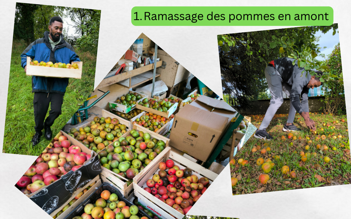
1. Ramassage des pommes en amont