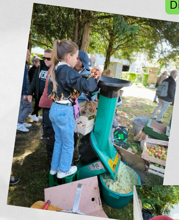
Animations avec les enfants