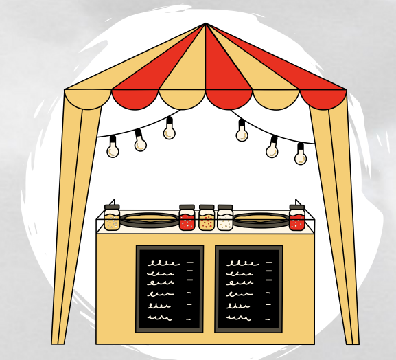
Recherche de fonds