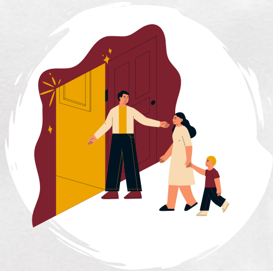
Aide au logement