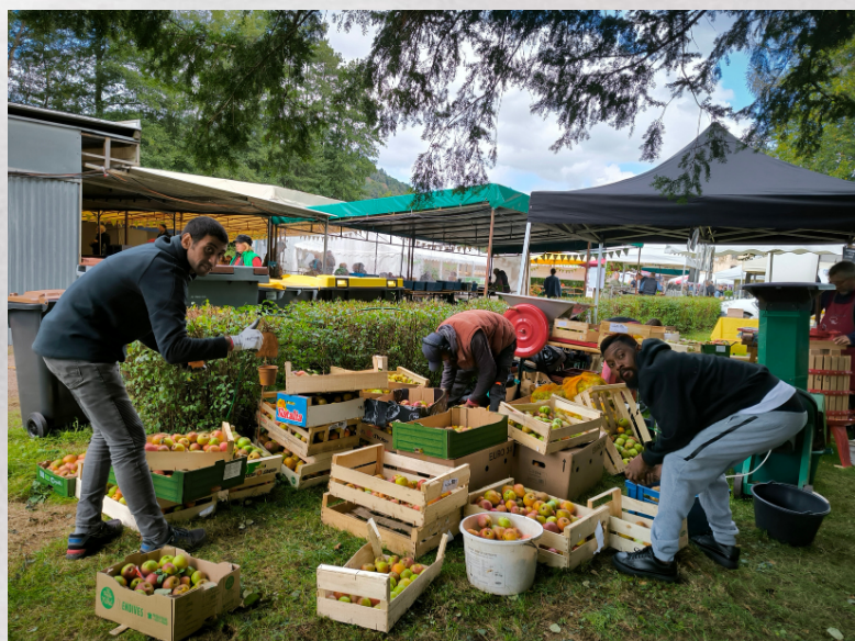
2. Tri des pommes