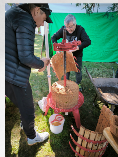
Lavage du matériel avant de recommencer