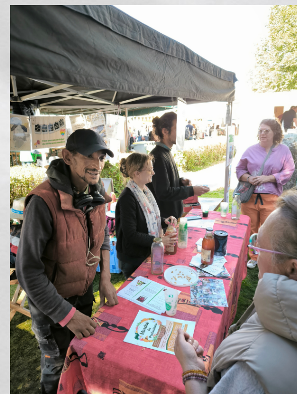
5. Vente du jus de pommes : au verre ou en bouteille Discussions avec le public