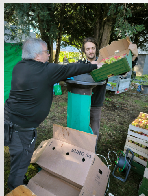
3. Passage des pommes dans le broyeur, puis dans le presseur pour obtenir le jus de pommes