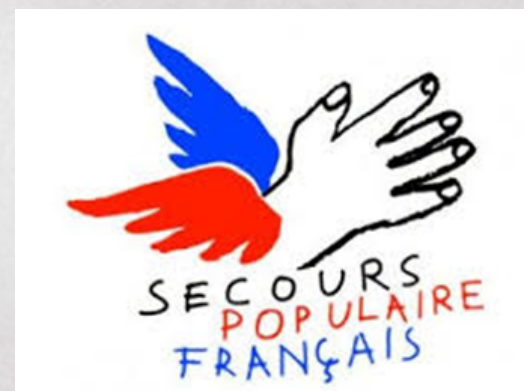
Distributions de nourriture Propositions d'activités et de sorties