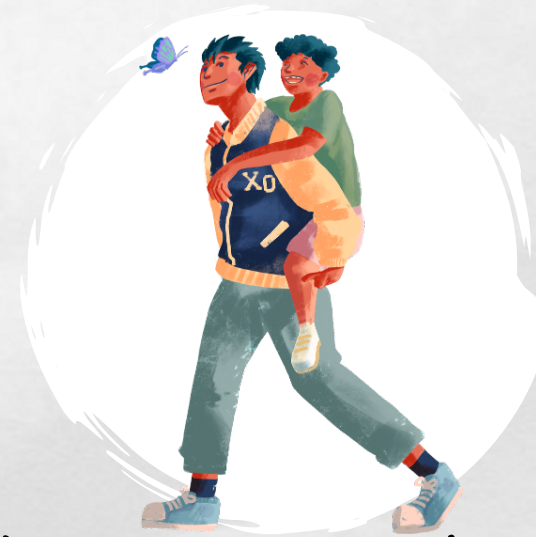
Accompagnement dans la vie quotidienne