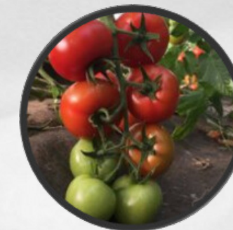
Bio La Damotte