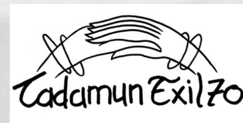
Administratif et juridique